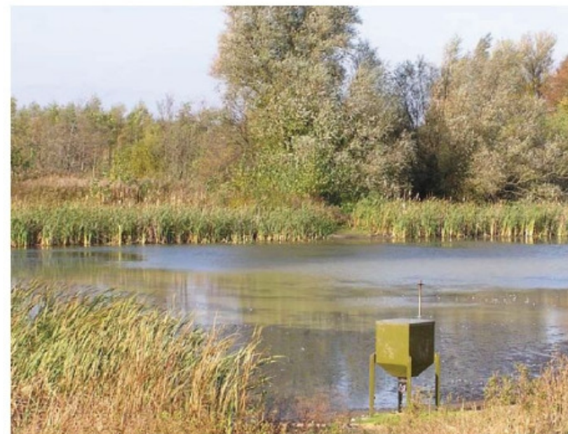
Fodring af ænder har i løbet af få år ødelagt denne nygravede sø. De første år var vandet rent og klart. Nu er søen næringsrig med brunt vand og dårlige iltforhold.

Som en sø-ejer med 600 kvadratmeter sø for nylig skrev til mig: "I år har min sø været rigtig sund at se på. Vandet har været klart med kransnålalger på bunden. Der har næsten ingen trådalger været. Alt har været ret fint. Men så flyttede en andemor med seks næsten voksne ællinger ind. I løbet af den sidste måned er søen blevet voldsomt forvandlet. Vandet er stadig klart, men ænderne har ædt kransnålen og til gengæld afleveret et fint lag dynd, der dækker bunden og planteresterne. Det har været meget hyggeligt med nogle andepar, der ind imellem har taget mere eller mindre stabilt ophold. Men dette her ligner i hvert fald umiddelbart en belastning."