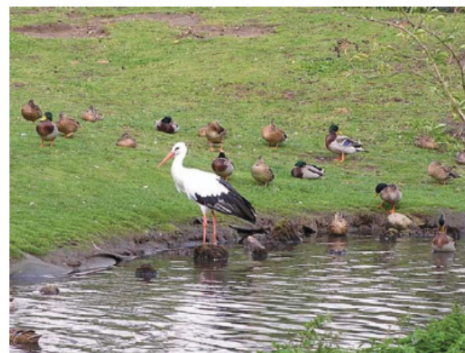
Andesø på Ferskvandsakvariet

Danmarks Kребseavlerforenings generalforsamling blev afholdt på Ferskvandscentret i Silkeborg. Her har man både søer med og uden ænder. Det gjorde et stort indtryk på mig at se forskellen mellem andesøerne med gråt vand og udstillingssøerne til frilandsakvariet med klart vand. Det er tydeligt, at ænderne belaster vandmiljøet i små søer.